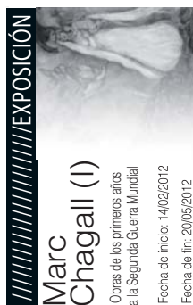
EXPOSICIÓN Marc Chagall (I) Otras de los primeros años a la Segunda Guerra Mundial Fecha de inicio: 14/02/2012 Fecha de fin: 20/05/2012