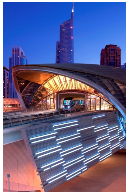
METRO DE DUBAI